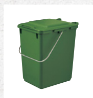
Systemy pojemników bezkołowych