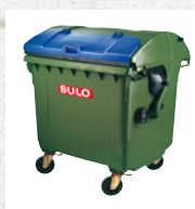
Systemy pojemników 4-kołowych