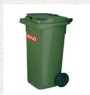
Systemy pojemników 2-kołowych

Nasz kompleksowy program produktów obejmuje pojemniki na odpady i surowce wtórne z tworzyw sztucznych i ze stali oraz systemy podpowierzchniowe, meble miejskie oraz innowacyjne systemy identyfikacyjne i wagowe dla niemal wszystkich wymagań gospodarki odpadami.